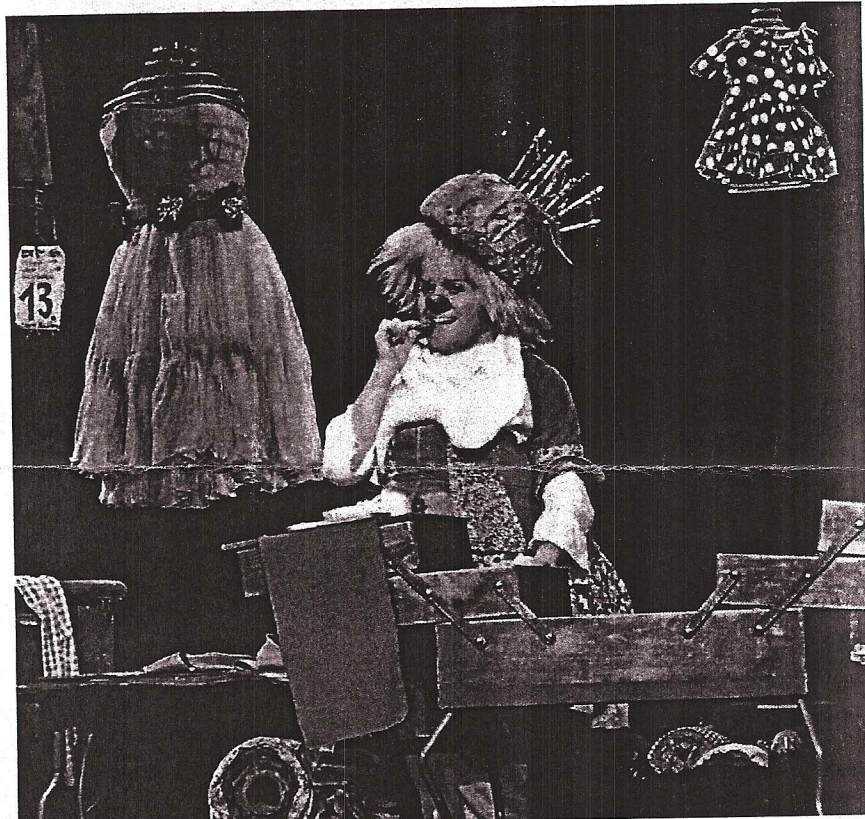
Clownin Gardi Hutter verstrickt sich in den Fäden des Schicksals. KHG