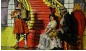
Theater Fidibus verzauberte im Parktheater die Kinder

Aktualisiert am 26.03.12, um 06:32 von Daniel Trummer